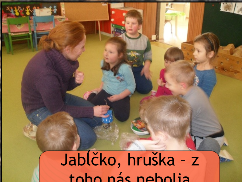
Jablíčko, hruška - z toho nás nebolia brušká