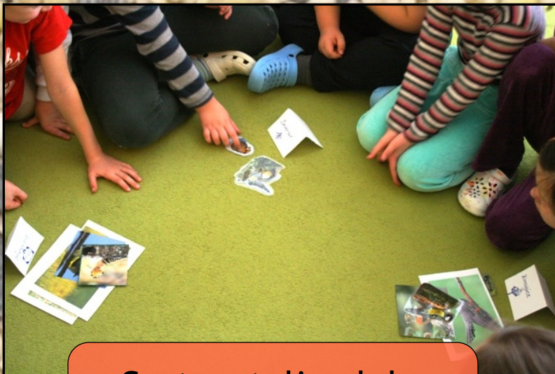
Cestovatelia alebo otužilci