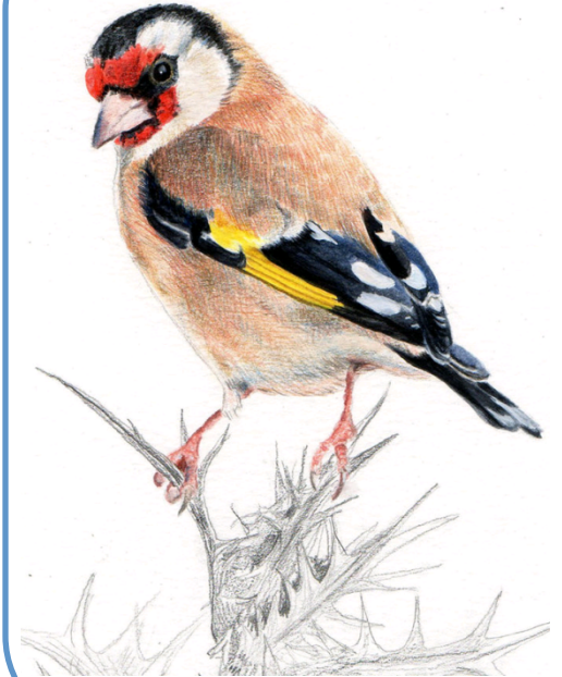
Vtáčiky na krmítkach